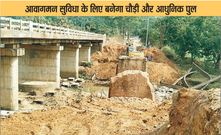
आवागमन सुविधा के लिए बनेगा चौड़ी और आधुनिक पुल

बिना सीमेंट, बिना आधुनिक मशीनों के बनी पुलिया ने दी सैकड़ों वर्षों की सेवा- अंग्रेजों के समय बनाई गई इस पुलिया में न तो सीमेंट का उपयोग था और न ही आधुनिक मशीनों का, इसके बावजूद इसकी मजबूती आज की कई नई संरचनाओं से कहीं बेहतर थी। सैकड़ों वर्षों पहले बनी इस पुलिया को ढहाने के दौरान भी यह साफ नजर आया कि इसकी नींव और निर्माण तकनीक कितनी टिकाऊ थी।