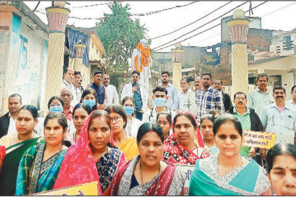
रायगढ़ शहरी क्षेत्र में भी कुष्ठ जागरूकता रैली आयोजित की गई।

संबंधी जानकारी प्रदान की गई। जागरूकता रैली गांव गांव पहुंचेगी। जहां लोगों को इस बीमारी के प्रति फैली भ्रांतियों को दूर किया जाएगा। इसके लिए हर ब्लाक में जागरूकता रैली का आयोजन किया जाएगा। स्थानीय व्यवस्था के तहत चलेगा अभियान।